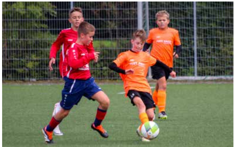
Dribbling – die D1- und D2-Junioren der Spielgemeinschaft Winnenden sind im Vorwärtsgang