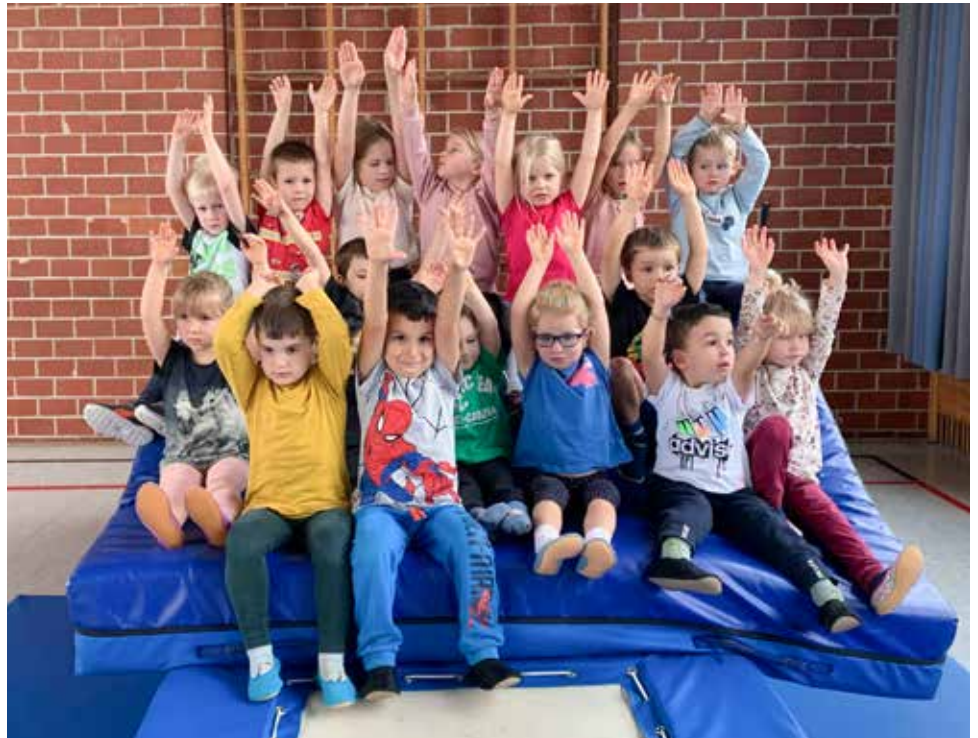
Vorschulturnen – und die Hände zum Himmel