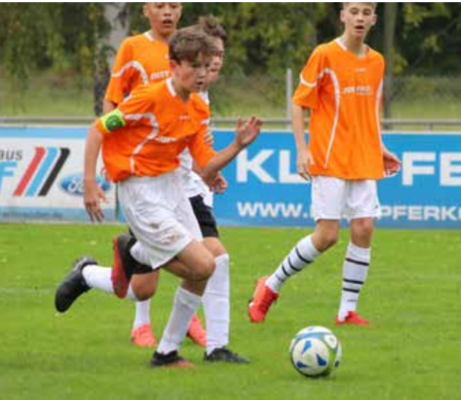
Dribbling – die C1-Junioren sind vorne dabei