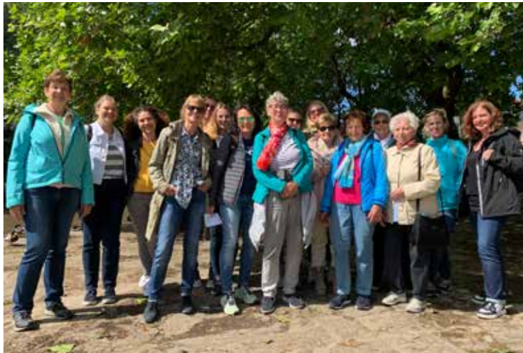
Gut gelaunt – die Reisegruppe im schönen Tübingen.