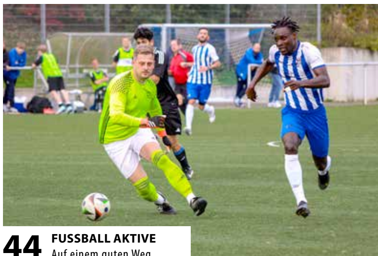
44 FUSSBALL AKTIVE Auf einem guten Weg