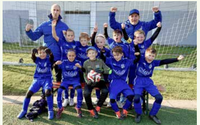
Vizemeister – die E2-Junioren freuen sich über ihren Erfolg