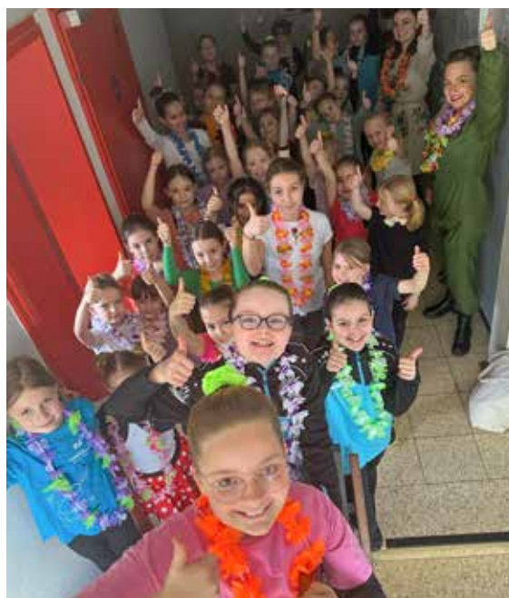
Vor dem Auftritt – die Turnmädchen beim Kinderfasching