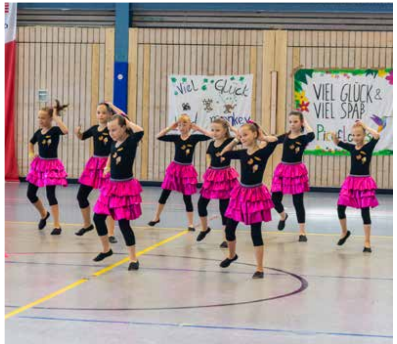
Top in Form –die „Quirlies“ beim Tanzwettbewerb der Württembergischen Meisterschaften in Fellbach