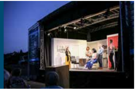
Open Air – Theater unter freiem Himmel