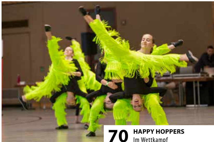
70 HAPPY HOPPERS Im Wettkampf