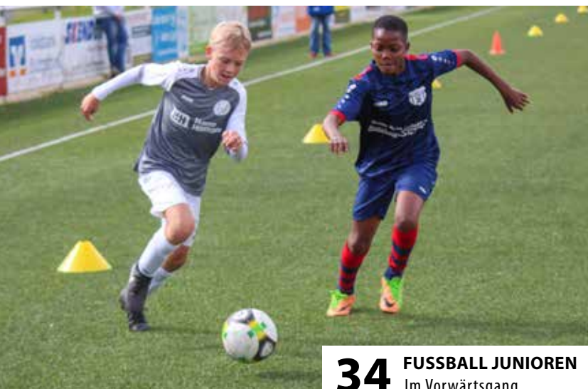
34 FUSSBALL JUNIOREN Im Vorwärtsgang