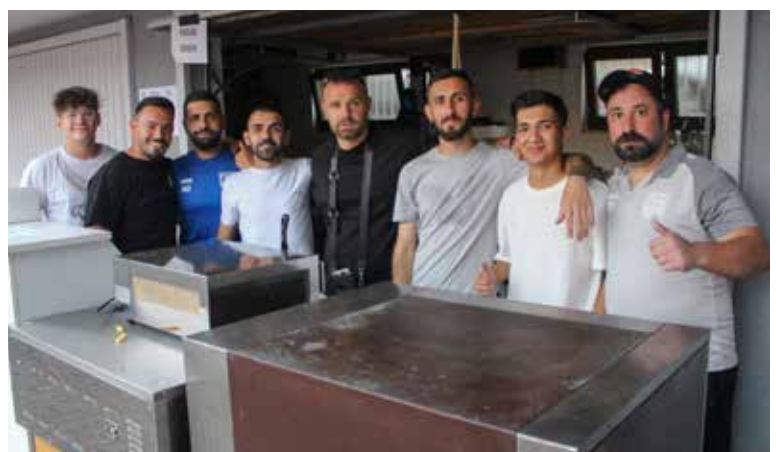
Arbeitseinsatz – nach dem Bänke stellen sorgte das Aktiven-Gastroteam und „Rebeccas Feinkost“ für kulinarische Kulturwochen.