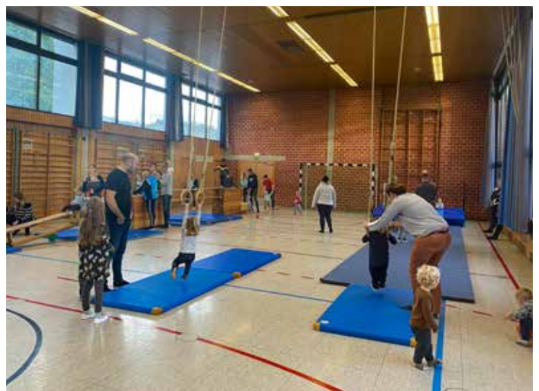
Geräteparcours – erste Turnübungen in der Gemeindehalle