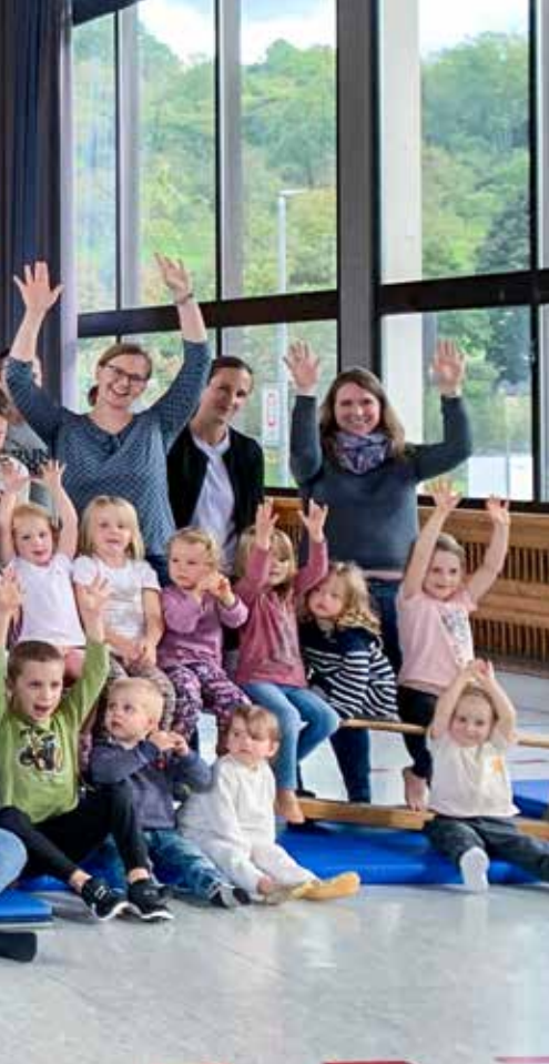
Eltern-Kind-Turnen – proppenvoll