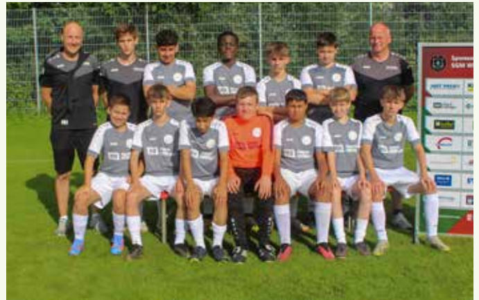
C1-Junioren – Spielgemeinschaft Winnenden