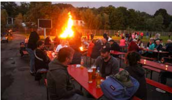
Der längste Tag – die Sommwendfeier findet 2025 am Samstag, den 28. Juni auf dem Höfen-Baacher Sportgelände statt.

26.07. Württembergische Meisterschaften Happy Hoppers →