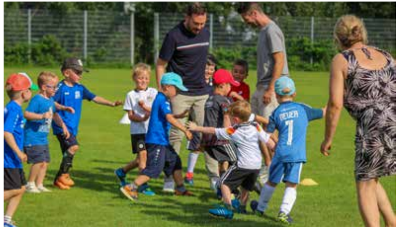
Rudelbildung – bevor es in die wohlverdienten Ferien ging traf sich im Juli die gesamte Fußballjugend zum gemeinsamen Fußballspiel Eltern gegen Kinder.

bei unserem Trikot Sponsor Taxi Ferman bedanken. Wir konnten endlich unsere schon etwas in die Jahre gekommenen Trikots durch neue sehr sportliche Trikots austauschen, die nun noch besser zu uns als starkes Team passen und uns natürlich doppelt und dreifach anspricht.