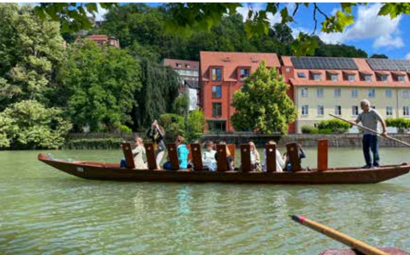
Eine Kahnfahrt, die ist lustig – eine Kahnfahrt, die ist schön...