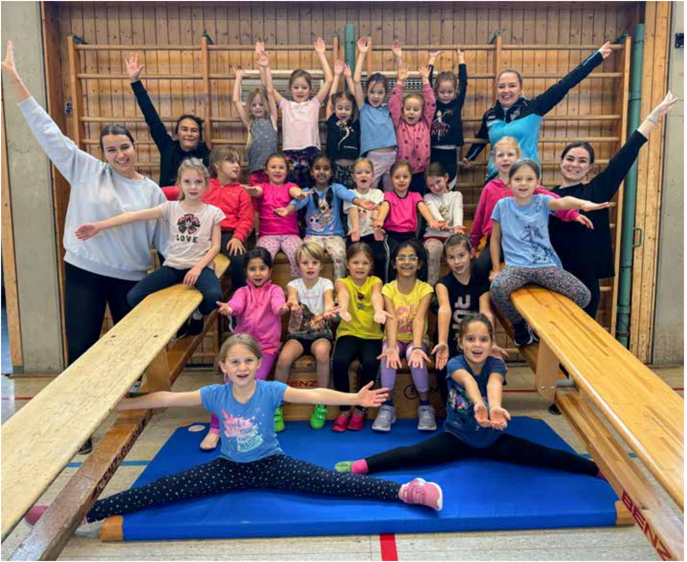
Mädchenturnen I – die Gruppe wächst beständig und es musste aufgeteilt werden.