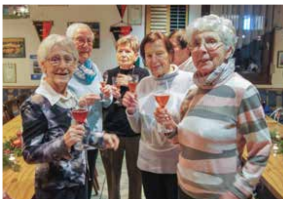
Prosit – der traditionelle Aperitiv bei der Weihnachtsfeier