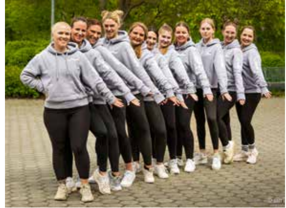
Cooler Hoodies – die „Funkys“ im neuen Outfit