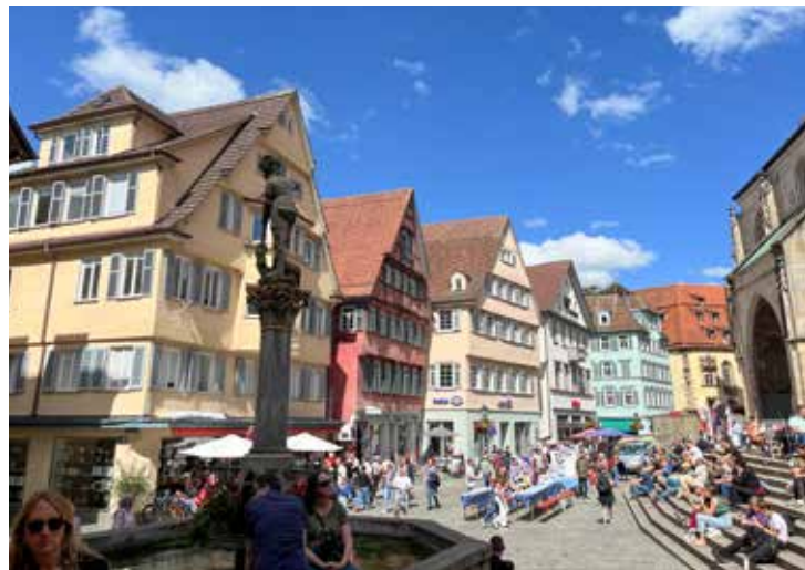
Entspannt – Ausklingen auf dem belebten Tübinger Marktplatz.

nach drinnen verlegen. Doch der Stimmung hat dies natürlich keinen Abbruch getan. Wie immer haben wir sozusagen als „Warm-Up“ unsere Abteilungsverammlung abgehalten und alle Inhaberinnen in ihren Ämtern bestätigt. An dieser Stelle möchten wir der gesamten Abteilung für ihr Vertrauen danken. Den restlichen Abend haben wir bei ausgelassener Stimmung mit anregenden Gesprächen verbracht und uns daran erfreut, was unsere Truppe wieder Leckeres für das Buffet gezaubert hat.