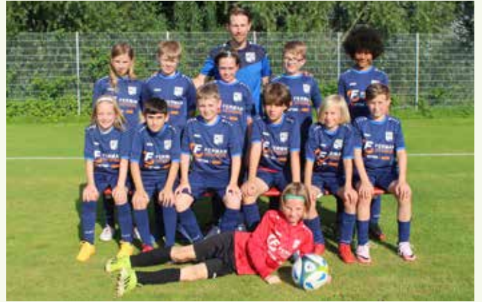
E1-Junioren – SF Höfen-Baach