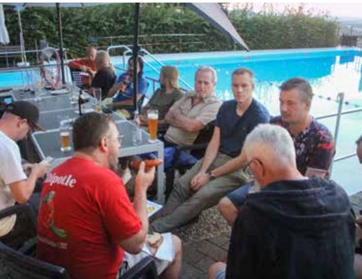
Sundowner – Vesper nach dem Training im Bürger Bädle