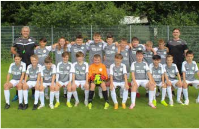
D1-Junioren – Spielgemeinschaft Winnenden