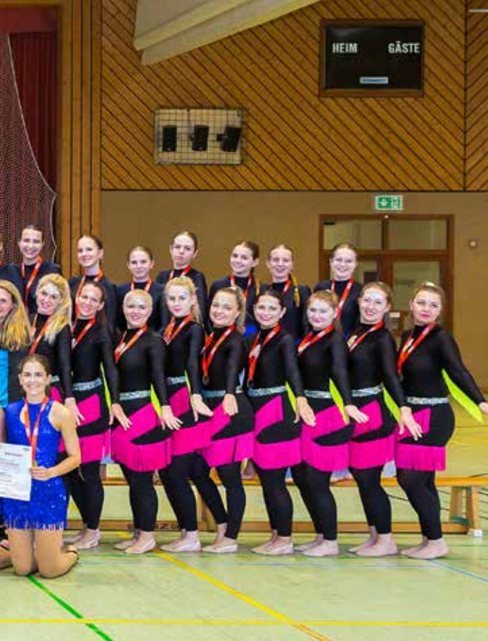
Gruppenbild – die Happy Hoppers beim Bezirksfinale in Oberndorf