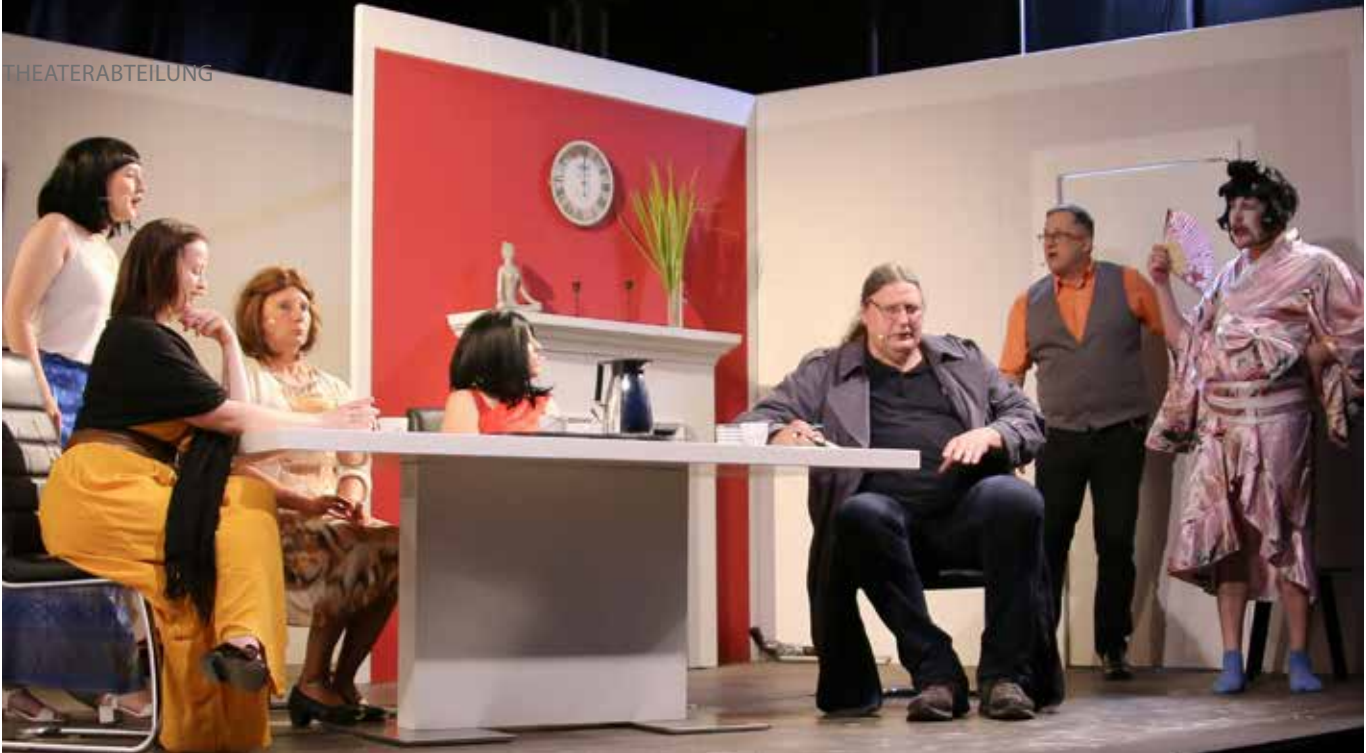
Freude am Spiel – die Liebe der Theaterabteilung zur Bühne und der Applaus des Publikums überwiegen so manche kleinere Widrigkeiten bei den Proben

Vorbühne manchmal nicht bespielbar war! Kurzum, alles andere als lustig, aber Freude und Humor haben überwogen, auch wenn einige unserer Frauen manchmal richtig leiden mussten!