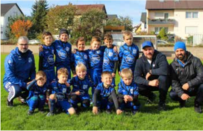
Bambini – SF Höfen-Baach