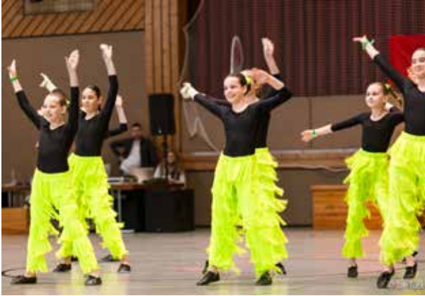
Voller Energie – die „Wilden Hühner“ drehen auf