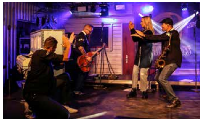
Stimmungsvoll – der Sommertreff im Weingut Häusser kam gut an.