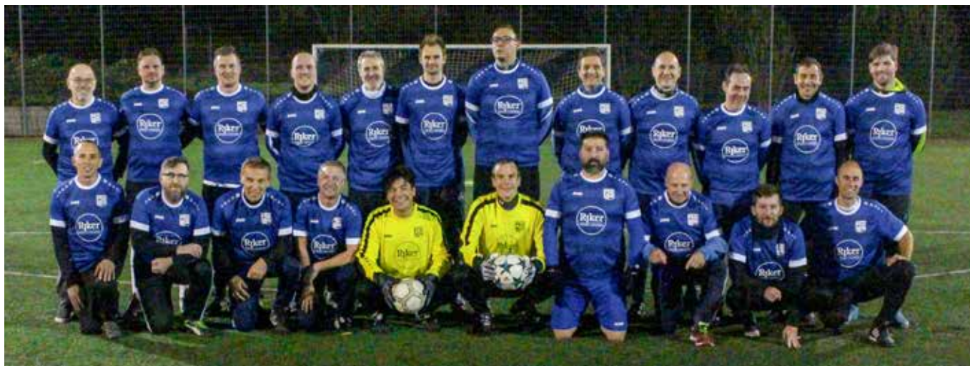
Dress Men – die Höfen-Baacher AH mit den neuen Trikots von Riker Wohnbau und Immobilien. Vielen Dank.

Donnerstag: 18.00 Uhr – 19.30 Uhr Training