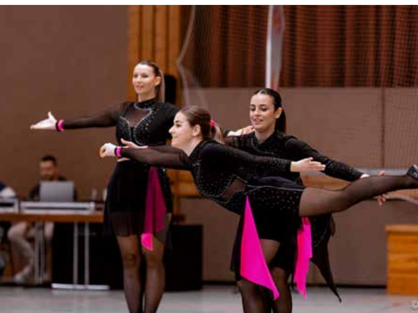
Balanceakt – die „Pringels“ beim Wettkampf