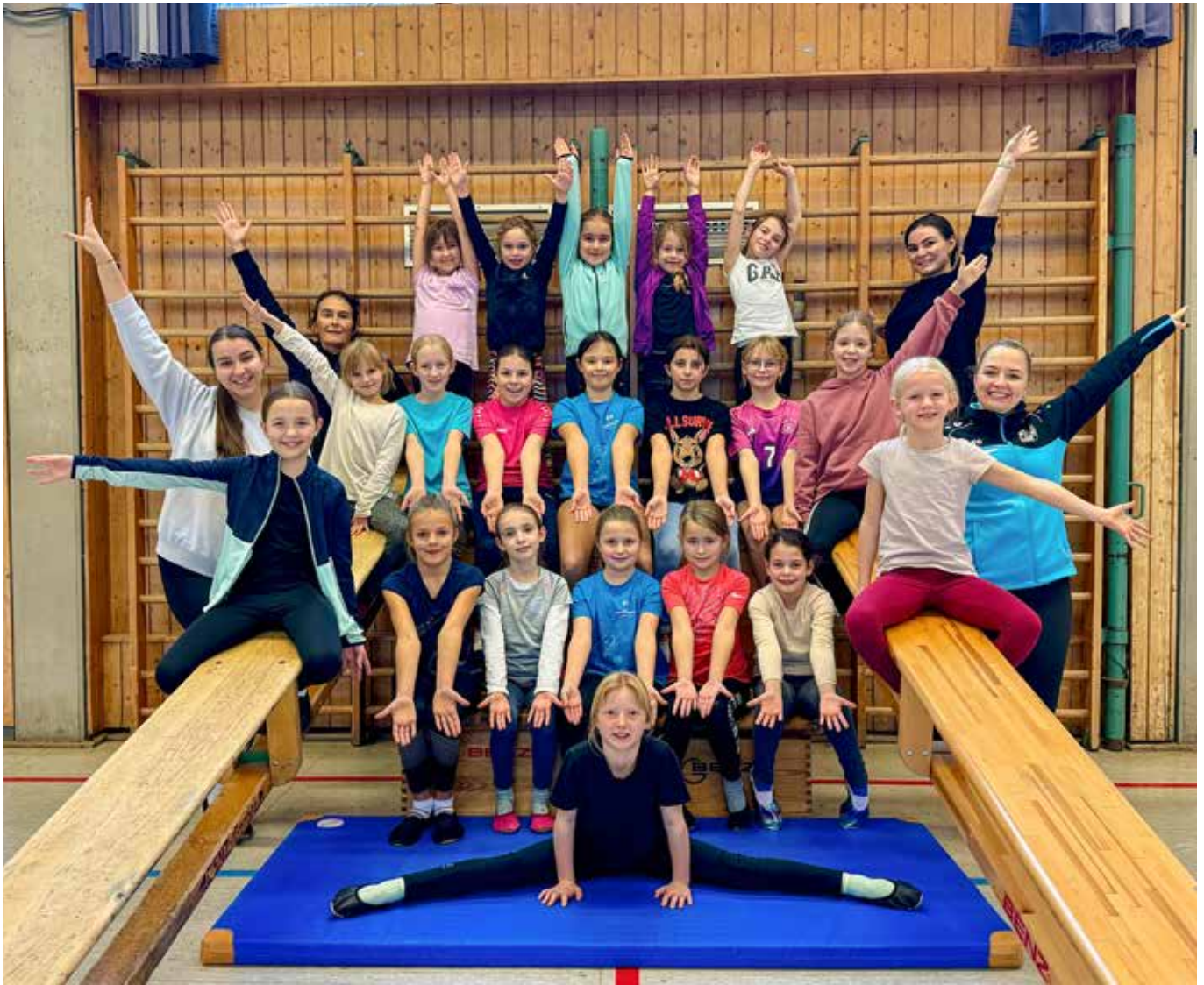
Mädchenturnen 2- Bewegungsmangel ist hier ein Fremdwort!

Luftballons für eine närrische Atmosphäre sorgten. Die Sporthalle war bis auf den letzten Platz gefüllt und die Stimmung hätte nicht besser sein können.