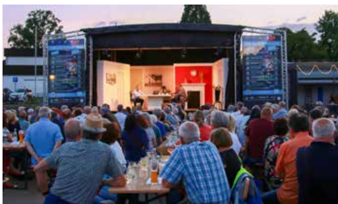
Open Air Theater – das neue Stück der Höfen-Baacher Theatergruppe lockte wieder zahlreiche Zuschauer zur Freilichtbühne

Ein herzlicher Dank geht an dieser Stelle an alle, die unseren Verein in der Vergangenheit in jedweder Form unterstützt haben. Insbesondere möchten wir uns bei unseren Übungsleitern bedanken, die mit viel Engagement und Aufwand die sport-