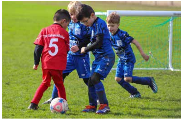
Die Wilden Tiger – die Bambini im neuen Outfit