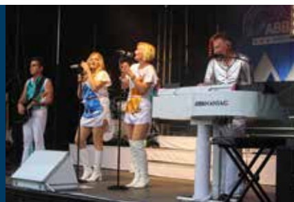
ABBAMANIAC – Verrückt nach ABBA