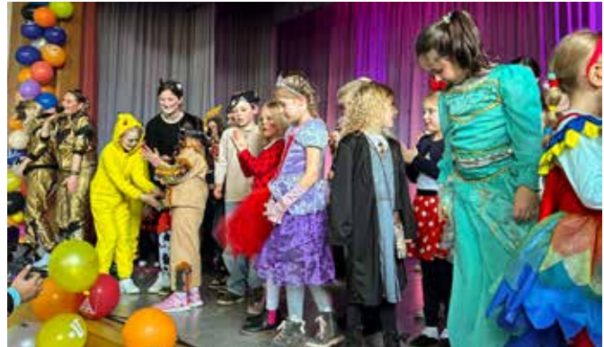
Helau – am Fachingsdienstag, 4. März 2025, füllt sich die Gemeindehalle wieder mit kleinen und großen Narren.