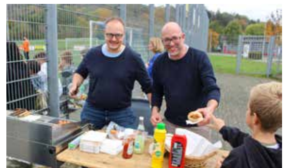
Senf oder Ketchup – egal ob Frühling, Sommer, Herbst oder Winter, die Griller von der Jugendabteilung stehen am Spielfeldrand und versorgen die Zuschauer bei den Spielen der Aktiven mit der obligatorischen Stadionwurst. Vielen Dank für euren Einsatz.