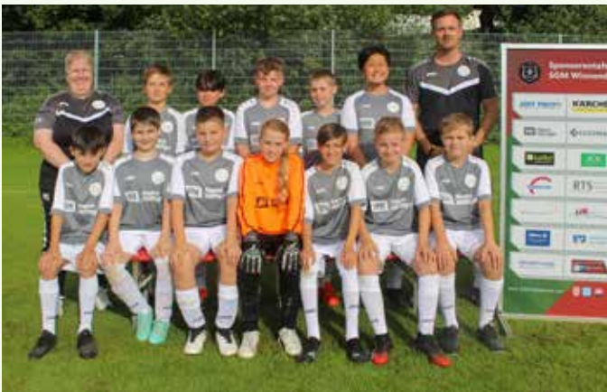
D3-Junioren-Junioren – Spielgemeinschaft Winnenden