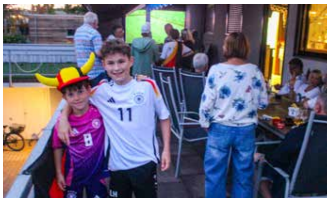
EM-Biergarten – große und kleine Fußballfans verfolgten im Vereinsheim die Spiele der deutschen Fußballnationalmannschaft.

Sicherlich sind wir in diesem Jahr mit den vielen Veranstaltungen an die Belastungsgrenze gestoßen. Ein ganz großer Dank gilt daher allen Helfern!!!!