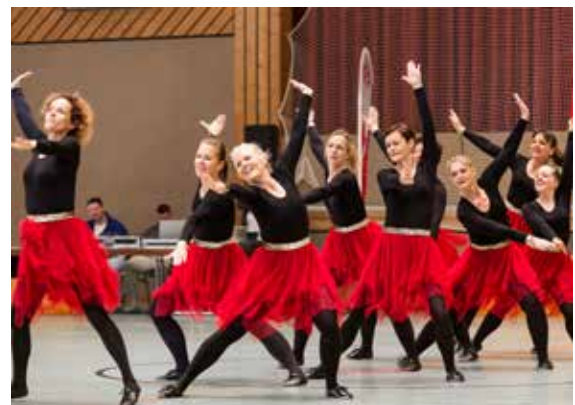
Gut bewertet – die „Alte Marillen“ beim Regionalscheid in Oberndorf am Neckar