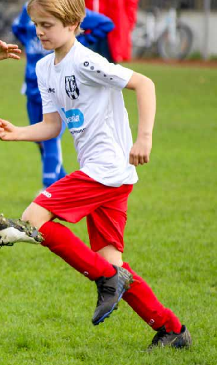
Torabschluss – die E-Junioren mit vollem Einsatz am Ball