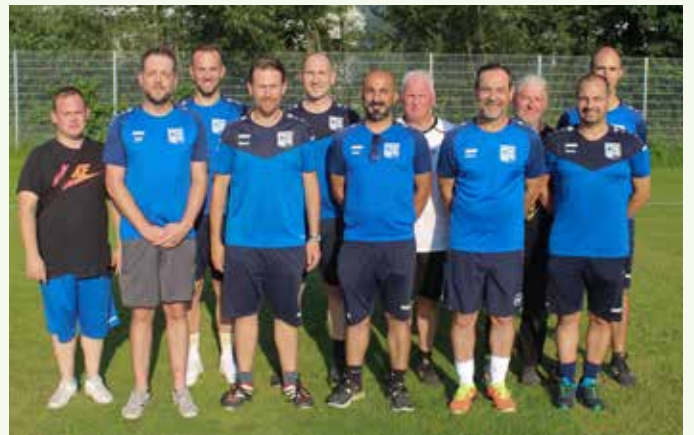
Team Trainer – SF Höfen-Baach