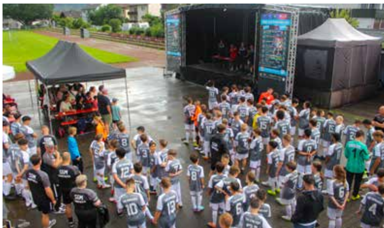
Saisonopening– die Mannschaften für 2024/2025 werden vorgestellt.