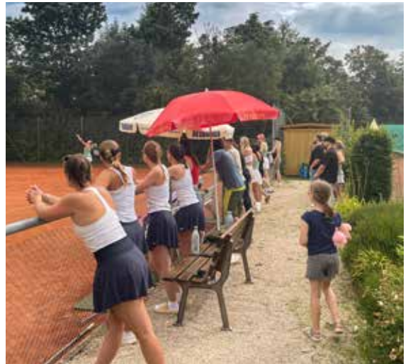
Aufstiegsspiel – Publikum am Spielfeldrand