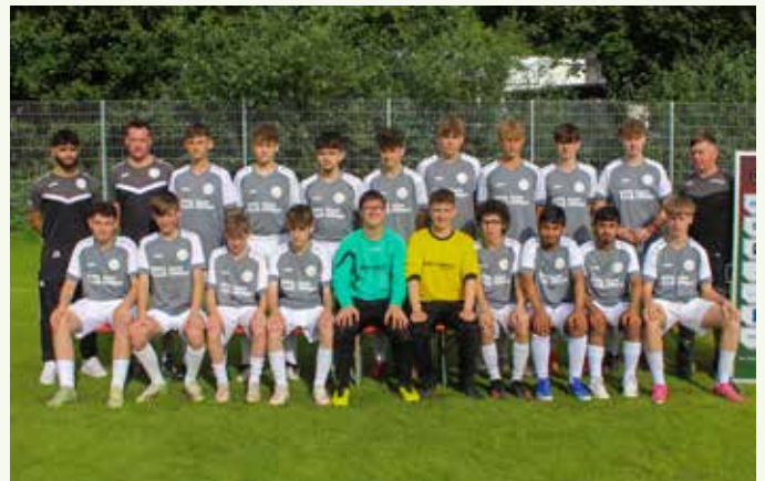
B-Junioren – Spielgemeinschaft Winnenden