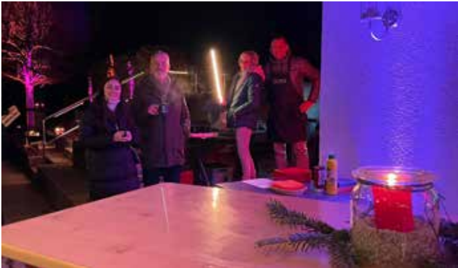
Glühweinfest – Winterstimmung auf dem Tennisgelände am Samstag, den 18. Januar 2025