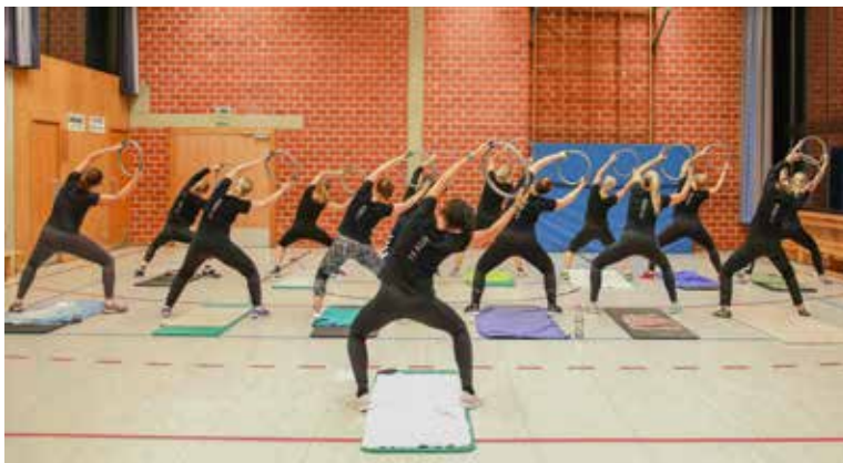
Schwungvoll – BodyFit-Training in der Halle

TEXT: ANNETTE KLENK, SARAH DAIS BILDER: ????