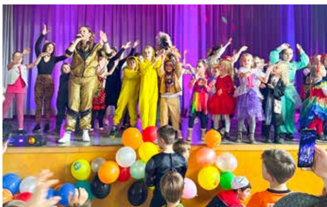
Partystimmung – Kinderfasching in der Gemeindehalle

Das vergangene Jahr war wieder geprägt von vielen sportlichen, wie auch kulturellen Vereinsaktivitäten. Dies wird mit dem Rückblick auf die Veranstaltungen und Aktivitäten in diesem Infoheft wieder deutlich. Unsere Theaterabteilung hat zum zweiten Mal ihre Vorführungen auf der Open Air Bühne am Vereinsheim durchgeführt – mit großem Erfolg. Die Kulturwochen hatten einen Besucherrekord mit mehr als 1500