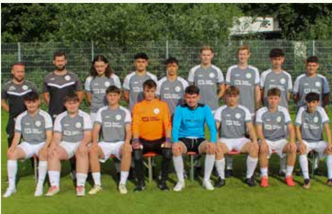
A-Junioren – Spielgemeinschaft Winnenden