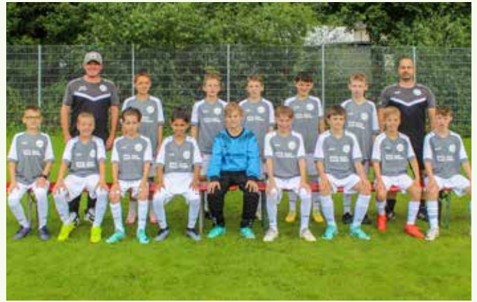
D2-Junioren – Spielgemeinschaft Winnenden