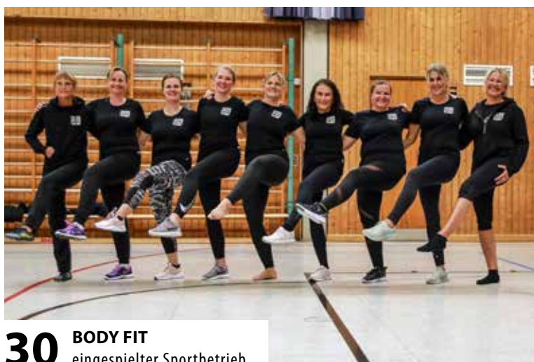
30 BODY FIT eingespielter Sportbetrieb