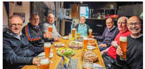
Nachtturnen – Flüssigkeitshaushalt ausgleich im Vereinsheim

Schauen Sie doch einmal Montagabends um 20:15 Uhr in die Gemeindehalle Höfen-Baach zum „Männerturnen“. Bewegung und Sport machen nicht nur Spaß, sondern sind für Herz, Kreislauf und die Seele gut. Wir bieten wie immer ein abwechslungsreiches Programm für jeden der sich noch nicht zum „alten Eisen“ zählt und fit bleiben möchte. Bei den Kulturtagen und Sommertreff waren einzelne beim Auf- und Abbau beteiligt. Vielen Dank nochmals an alle Helfer.