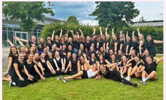
Die Happy Hoppers bei den deutschen Meisterschaften in Neumarkt