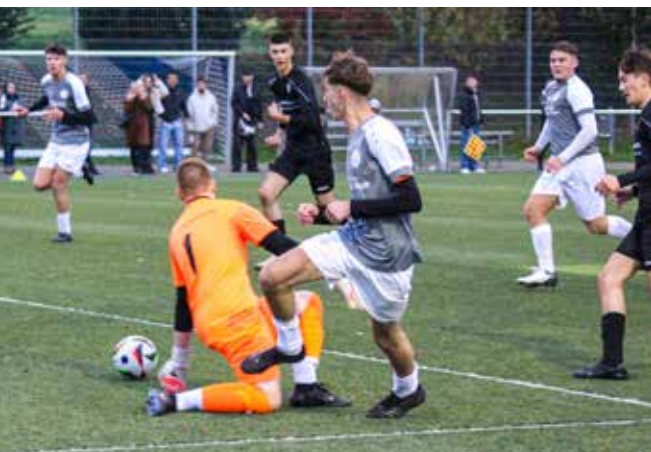
Torchance– die A-Junioren sorgen für Gefahr im Strafraum