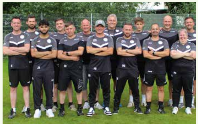
Team Trainer – Spielgemeinschaft Winnenden