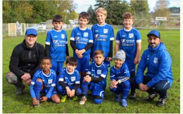
F1-Junioren – SF Höfen-Baach