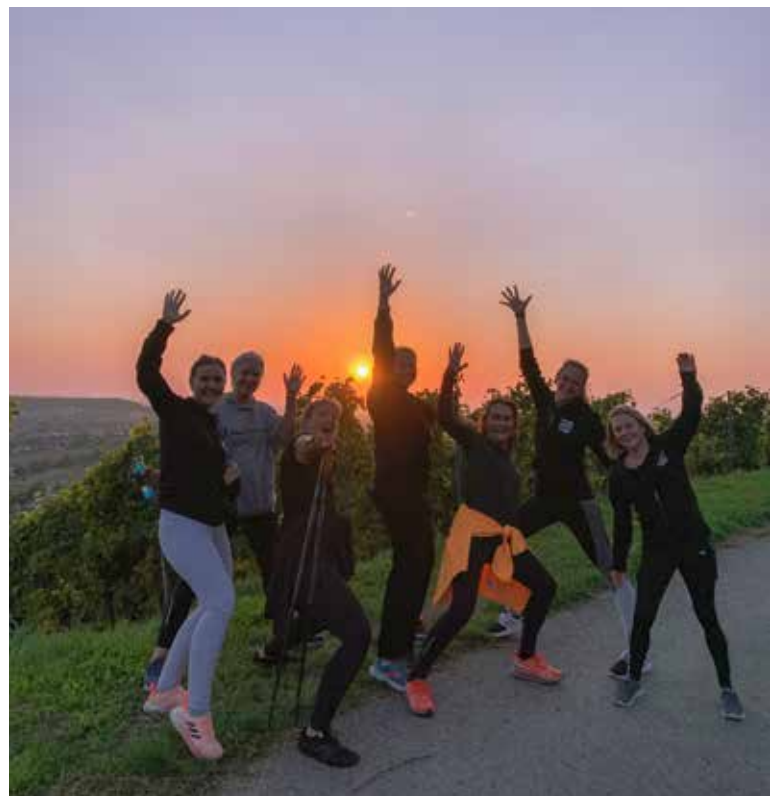
Stimmungsvoll – Walking bei Sonnenuntergang

Kaum haben wir im neuen Jahr ein paar Gänge hochgeschaltet und die trägen Tage hinter uns gelassen, forderten auch schon die kleinen Narren ihren Tribut und enterten im Februar die bunt geschmückte Halle. Bei soviel Trubel, Spaß und Tanz muss man sich zwischendurch natürlich ordentlich stärken können und so haben wir den Kinderfasching der Happy Hoppers wieder traditionell mit Kuchen, Snacks und einem engagierten Team in der Küche unterstützt. →