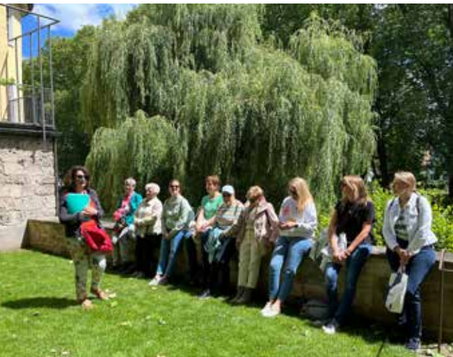
Auf Tour – gespanntes Lauschen am Hölderlinturm.