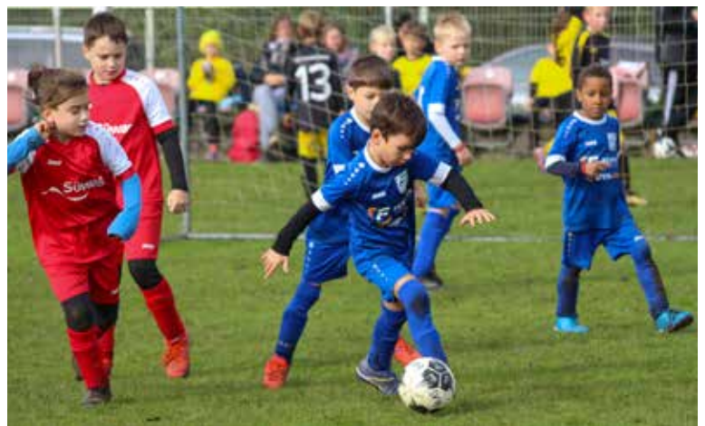
Dribbling – die F-Junioren beim Spieltag

tern wie Kinder tatkräftig mit. Die Spieltage sind für die Kleinsten „echte Fussballspiele“ die zu Beginn natürlich ungewohnt sind, dann aber immer Routine werden, sodass die Kinder schon fast wie Profis auf die Funino Tore schießen. Jedes Tor wird gefeiert. Unser gemeinsamer Anfeuerungsschrei ist nach wie vor unübertroffen und stärkt das Gemeinschaftsgefühl und feuert natürlich alle an. Die Mithilfe bei Festen wie z.B. Heimspieltagen oder der Sonnenwendfeier ist großartig und verdient Anerkennung. Dies führt zu einem noch bessern Gemeinschaftsgefühl als großes Fussball Team. Herzlichen Dank dafür. Wir danken in dieser Saison sehr herzlich der Riker Wohnbau + Immobilien GmbH als Trikot Sponsor. Diese erlaubte es uns, neue Trikots für die komplette G-Jugend anzuschaffen.