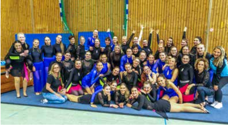
Teamgeist – bei den Baden-Württembergischen Meisterschaften in Ravensburg