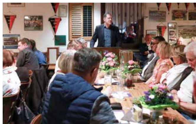
Hauptversammlung – OB Holzwarth spricht zu den Mitgliedern