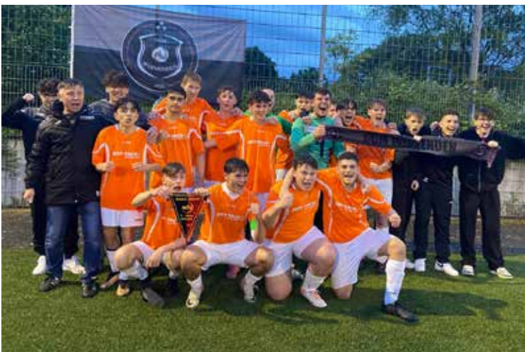
Erfolgreich – die B-Junioren wurden 2023/2024 Meister