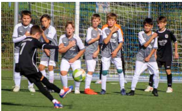
Mauerbildung – die D3-Junioren verteidigen ihr Gehäuse.

Neben den sportlichen Erfolgen liegt ein wichtiger Fokus der Trainer auf der Vorbereitung der Spieler für die C-Jugend. Mit gezielter Förderung und Weiterentwicklung werden die Talente Schritt für Schritt an die Herausforderungen der nächsten Altersklasse herangeführt.