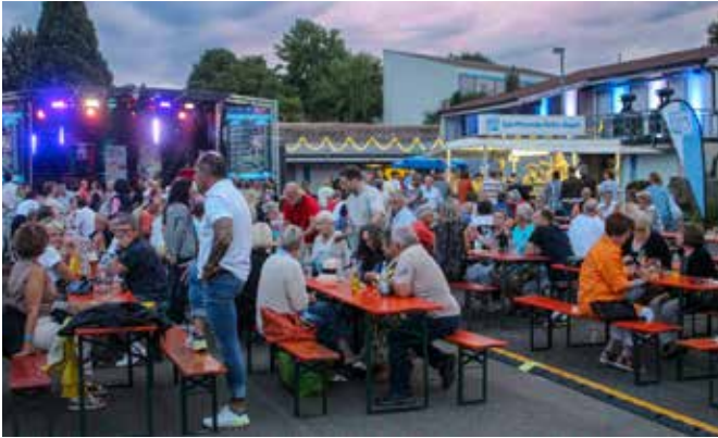
Kultur für alle – im Sommer wurde auf dem Höfen-Baacher Sportgelände wieder einiges geboten.