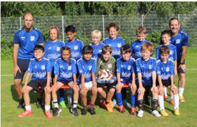
E2-Junioren – SF Höfen-Baach