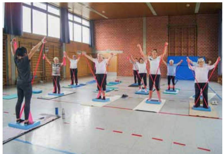
Im Training – unsere sehr flexible Seniorinnengruppe

Sitzzyoga oder Laufmemory stehen auf dem Plan – den Abschluss des aktiven Montagnachmittags bildet stets eine stimmungsvolle Entspannungseinheit.