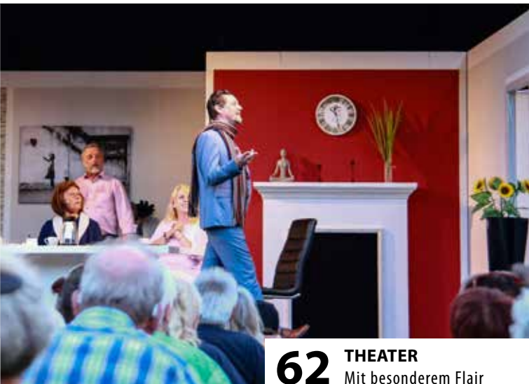
62 THEATER Mit besonderem Flair