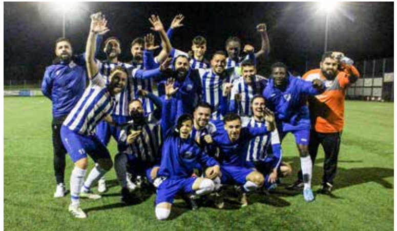
Derbysieger – beim Flutlichtspiel gewannen die Sportfreunde im Bezirkspokalspiel (2. Runde) 3:2 gegen den Lokalrivalen SV Hertmannsweiler.