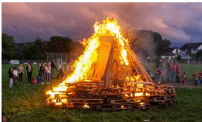
Feuerlicher Sommerabend – die Sommwendfeier konnte in diesem Jahr wieder mit brennendem Holzstoß durchgeführt werden.