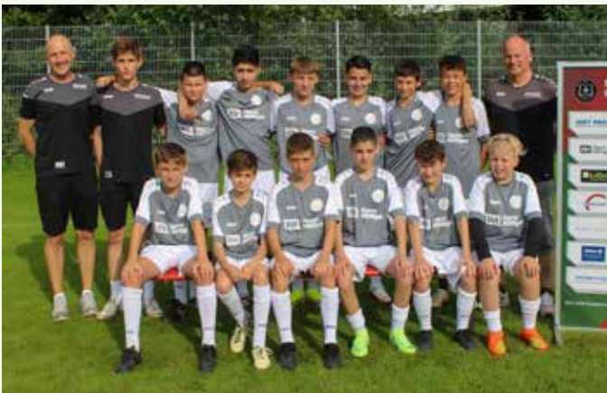
C2-Junioren – Spielgemeinschaft Winnenden