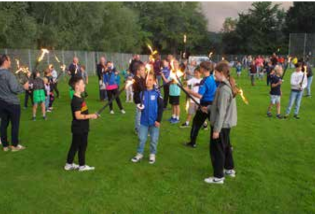
Fackellauf – bei der Sommwendfeier entzünden traditionell die Kinder das große Feuer am Sportgelände.