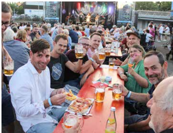
Notte italiana – gemeinsamer Besuch der AH bei den SHB-Kulturwochen