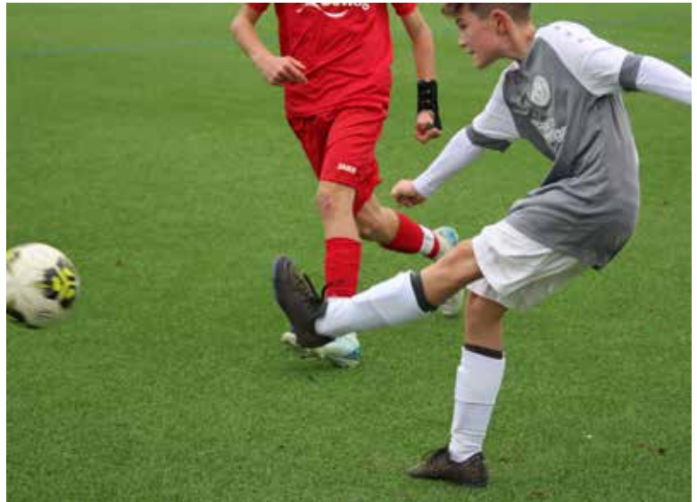
Zweikampf – die C2-Junioren

Die engagierte und herausragende Arbeit des Trainerteams wurde von Spielern und Eltern gleichermaßen geschätzt. Mit diesem positiven Ansatz blickt die D3 optimistisch in die Zukunft, um weiter als Mannschaft zu wachsen.