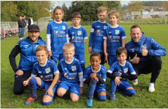
F2-Junioren – SF Höfen-Baach