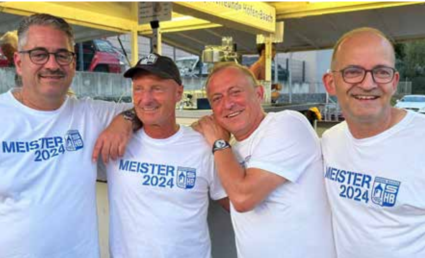
Meistershirts – die Herren 50 feiern ihren Aufstieg bei den Kulturwochen