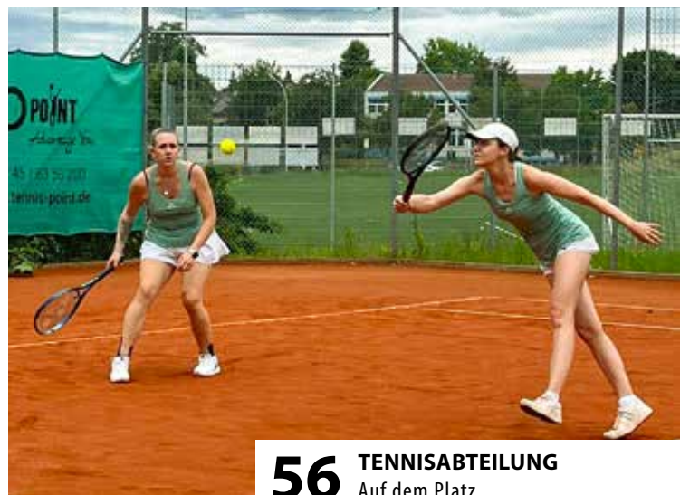
56 TENNISABTEILUNG Auf dem Platz