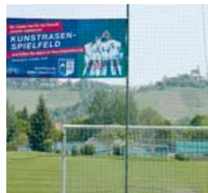
Hier entsteht der neue Kunstrasen.

Der Bedarf und das Konzept der Sportfreunde haben den Gemeinderat bewogen, das Bauvorhaben zu unterstützen. Auch der Württembergische Landessportbund hat eine Förderung der Maßnahmen zugesagt. Um die Gesamtinvestition von 695.000 € aufzubringen, hat die Hauptversammlung